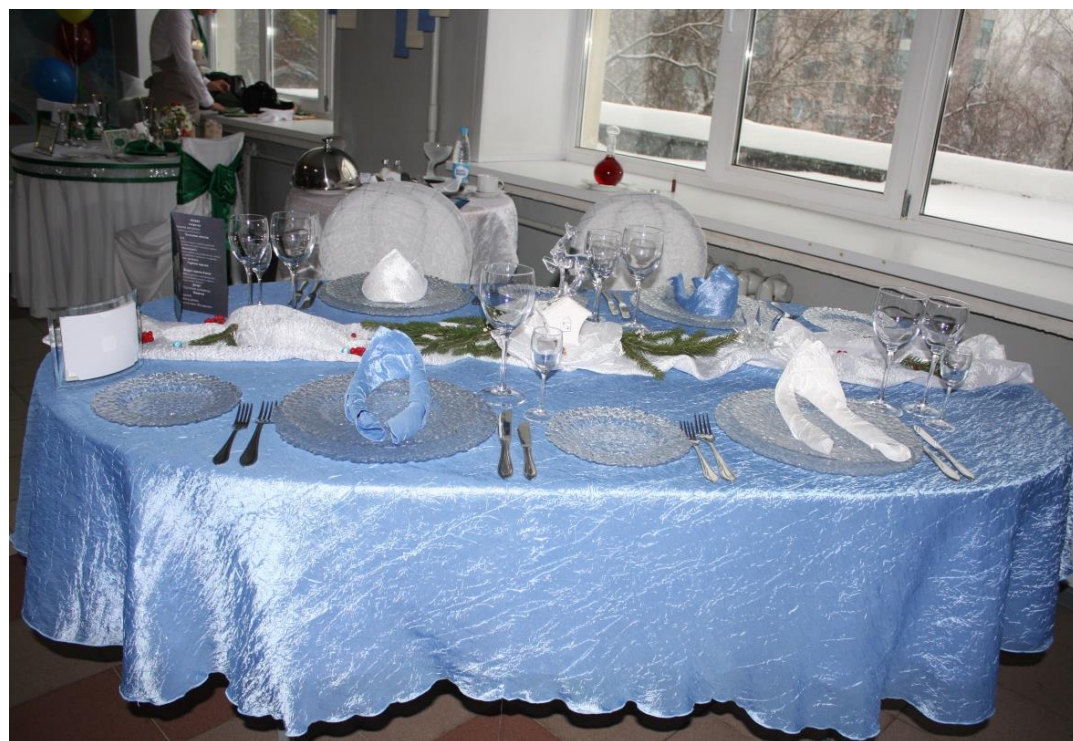
Екатеринбургский торгово- экономический техникум