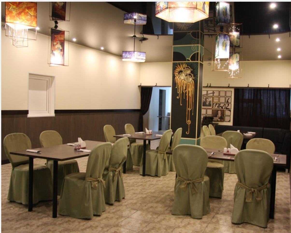
Учебное кафе «Сказы»